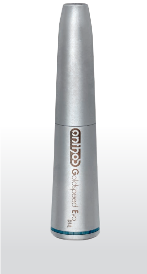
GOLDSPEED Evo S1-L (1:1) Conservadora

Conservadora y uso general. Relación de transmisión 1:1, cabezal y empuñadura esterilizable en autoclave y termodesinfectable, bloqueo de la fresa mediante push-button, spray individual, fibra óptica integrada de elevada luminosidad y resistente al tratamiento en autoclave. Diámetro cabezal 9,5 mm.