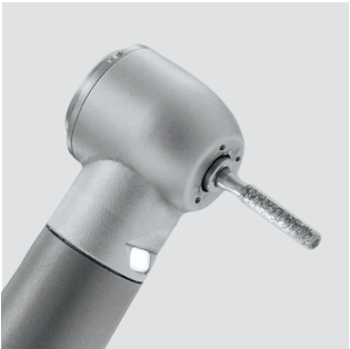
EVO miniature K